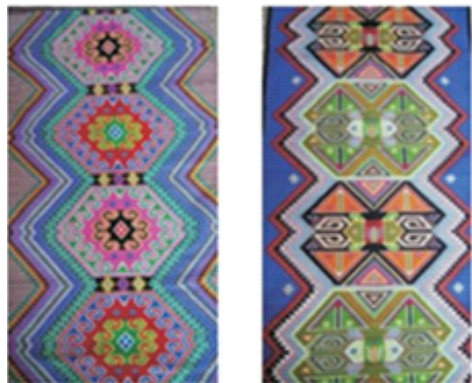
Рис. 3. Двадцать четыре петли, раппорт по утку

ются многократно и распределяются по двум типам орнаментов. Два типа орнаментов взаимозависимы и образуют узор. Этот метод похож на восемь даосских диаграмм и диаграммы тайцзи, где черное и белое сосуществует и переходит друг в друга. Независимо от того, какой объект из звеньев цепи представляет собой орнамент, мы можем видеть, что он являет собой бесконечное поклонение народа туцзя жизни. Поэтому узор из петель является необходимым элементом для цветочного орнамента в брачной церемонии для девочек туцзя.