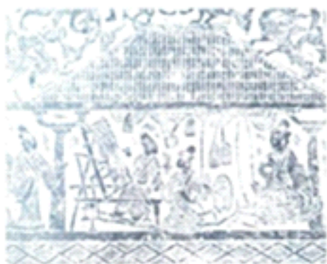
Рис. 1. Ткацкий станок династии Хань, текстильный портрет, каменная протирка

«Ксиланкапу» – это «язык» туцзя. «Ксилан» означает подстилку, «капу» означает цветок, а «ксиланкапу» означает подстилку из цветов народа туцзя. Часто перед словами «мостовая из цветов» помещают слово «ту», чтобы указать на характерные черты народности туцзя, которые присутствуют в этом промысле. Одежда Тухуа ценится народом туцзя, оно считается средоточием мудрости и навыков и называется «цветком туцзя». Согласно обычаям национальности туцзя, в прошлом, когда девушки туцзя выходили замуж, им приходилось делать красивые «ксиланкапу» на ткацком станке. Обычай имеет долгую историю вплоть до четырех тысяч лет.