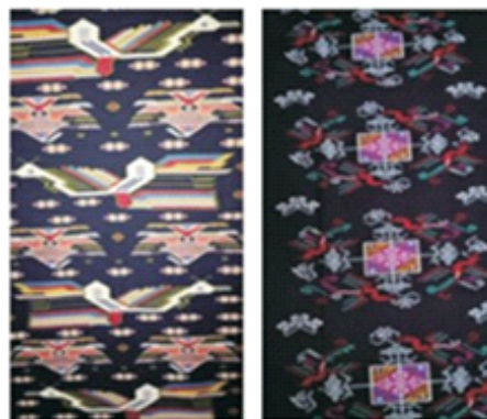
Рис. 4. Орнамент цапли с печатью четырех фениксов

Таким образом, узор можно разрывать столько раз, сколько необходимо, чтобы можно было использовать неограниченное количество орнаментов для изображения, тем самым расширяется пространство для выражения. Оно может отражать стиль большинства статичных форм графического изобразительного искусства, таких как классическое, народное, современное, фотографическое, китайская декоративная и западные стили живописи.