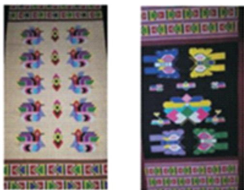
Рис. 2. Гуаян. Птица. Цветок. Бабочка. Пион.

Цветочные узоры – цветы тыквы, цветы виноградной лозы – это все образы растений, которые растут перед домами народа туцзя, а также на полях. В ксиланкапу можно видеть образ жизни и основные черты культуры народа туцзя.