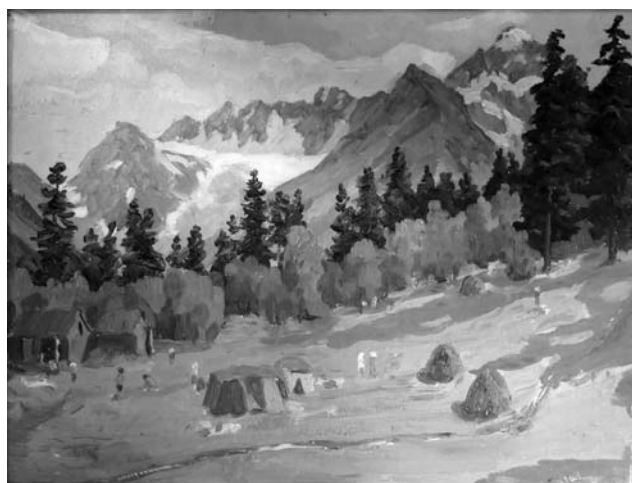
Рис. 4. Бостанов М. С. Лагерь альпинистов. 2009 г. Холст, масло. 60×90. Фонд КЧГУ

...Уже смеркалось, писать смысла не имело. Сложив этюдники в куртки, мы уселись сверху и скатились с ледника, как на санях. Конечно, на следующий день вернулись со студентами и написали отличные виды Махарского перевала».