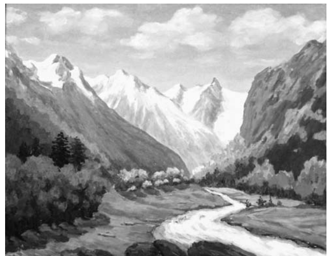
Рис. 3. Бостанов М. С. Вид на горы Домбая. 2009 г. Холст, масло. 80×90. фонд КЧГУ

Другая картина «Утро в горах», как и многие другие произведения, написана также с натуры. «Здесь задача состояла в том, чтобы передать состояние горных вершин в лучах восходящего солнца. Необходимо было заранее подготовиться и ждать, когда с появлением солнца оживет природа. Сколько цветowych переливов, сколько ярких красок на склонах гор! Снизу поднимался утренний молочный речной туман, надо было успеть запечатлеть вершины, пока он их не закрыл. На переднем плане еще не проснувшийся темный лес замер в ожидании солнечных лучей, горный ручей струился, напоенный ароматом осенней природы. Все это великолепие оставляло неизгладимое впечатление. Работа бала выполнена очень быстро, буквально в течение одного часа».