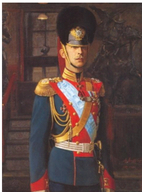
Леонтовский А.М. Портрет великого князя Дмитрия Константиновича, 1906. Х.м., 127,7х95,8. Государственный музей истории Санкт-Петербурга.

Дошедший до нас портрет кисти А.М. Леонтовского датирован 1914 годом: видно, написан либо окончен после смерти великого князя (1847–1909). Владимир Александрович изображен в полный рост сидящим в кресле со скрещенными внизу ногами на фоне большого количества книг. На портретируемом генеральские брюки с красными лампасами и гражданская темная куртка, под которую надета белая сорочка. Тяжелый, цепкий взгляд из-под нависших век направлен на зрителя. Обращают на