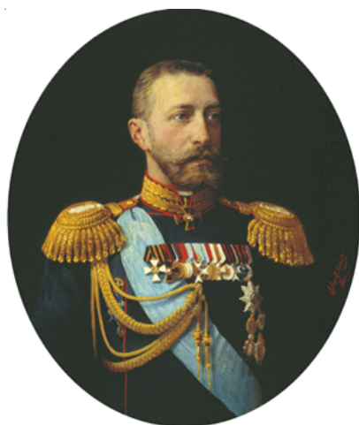
Леонтовский А.М. Портрет великого князя Константина Константиновича. 1901. Х.м., 84 х 71. Военно-исторический музей, Санкт-Петербург

Самым ранним из данной категории творческого наследия А.М. Леонтовского является портрет великого князя Константина Константиновича, датированный 1901 годом (ВИМ). Указанная датировка опровергает утверждение исследователя коллекции великого князя Константина Константиновича Е.М. Реутовой о том, что его знакомство с творчеством художника произошло в Костроме в 1902 году, когда в музее архивной комиссии он увидел портрет кисти А.М. Леонтовского, после чего последовал большой заказ от царской семьи [2, С. 36]. Константин Константинович – второй сын великого князя Константина Николаевича, внук Николая I, двоюродный брат императора Александра III; на момент создания портрета – Главный начальник военно-учебных заведений, генерал-лейтенант и генерал-адъютант.