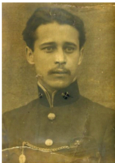
Леонтовский А.М. в студенческие годы.

Несмотря на то, что в Академии художеств А.М. Леонтовский обучался исторической живописи, свои предпочтения он отдал портретной, войдя в историю русского искусства как портретист. Наряду с женскими образами, к которым он испытывал особый трепет, А.М. Леонтовский портретировал еще и военачальников, а также членов российской императорской семьи [3. С. 90]. Даже по количеству сохранившихся до нашего времени портретов мы понимаем, что это были не единичные заказы. В связи с чем справедливо отмечено, что «творчество А.М. Леонтовского оказалось в тесной связи с духом времени» [1. С. 206].