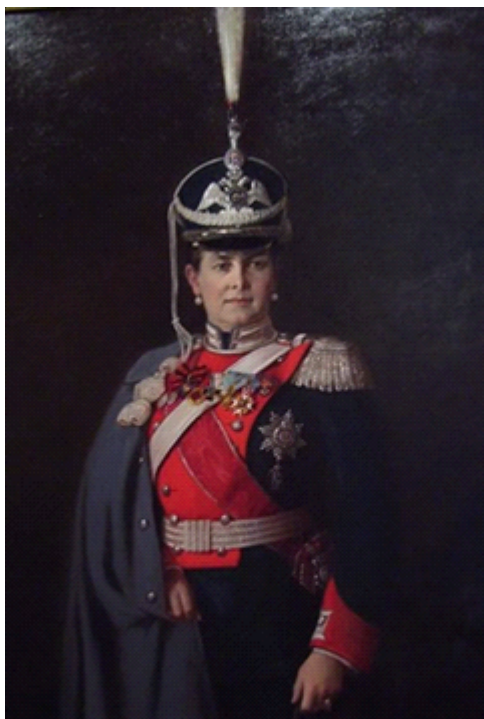
Леонтовский А.М. Портрет великой княгини Марии Павловны, 1912. Х.м., 177x100. Государственный Музей-заповедник «Царское Село»

себя внимание молодые ухоженные руки. В этом камерном портрете художник смог передать не только большой опыт и человеческую мудрость, но и жизненную усталость.