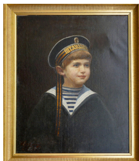
Леонтовский А.М. Портрет цесаревича Алексея Николаевича, 1909. Х.м. Государственный Музей-заповедник «Царское Село».

Мода на детские матросские костюмчики началась в 1870-е годы, зародившись в Великобритании. В 1846 году четырехлетнему принцу Уэльскому Эдварду подарили уменьшенную версию униформы рядовых Королевской яхты,