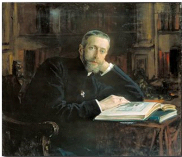
Леонтовский А.М. Портрет великого князя Константина Константиновича, 1906. Х.м., 96x107. Литературный музей ИРЛИ, Санкт-Петербург.

«Гамлет, принц Датский» У. Шекспира, над переводом которой великий князь работал с 1889 по 1898 годы. Именно в переводе великого князя Константина Константиновича эта книга неоднократно издавалась с обширными комментариями. В исследуемом камерном портрете художнику удалось передать неординарную поэтическую личность Константина Романова, его утонченный художественный вкус. Справедливо, что это одно из лучших изображений великого князя.