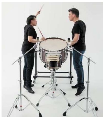
Рис. 2. Фото поединка исполнителей пьесы Лю Хэна «Face 2 Face»