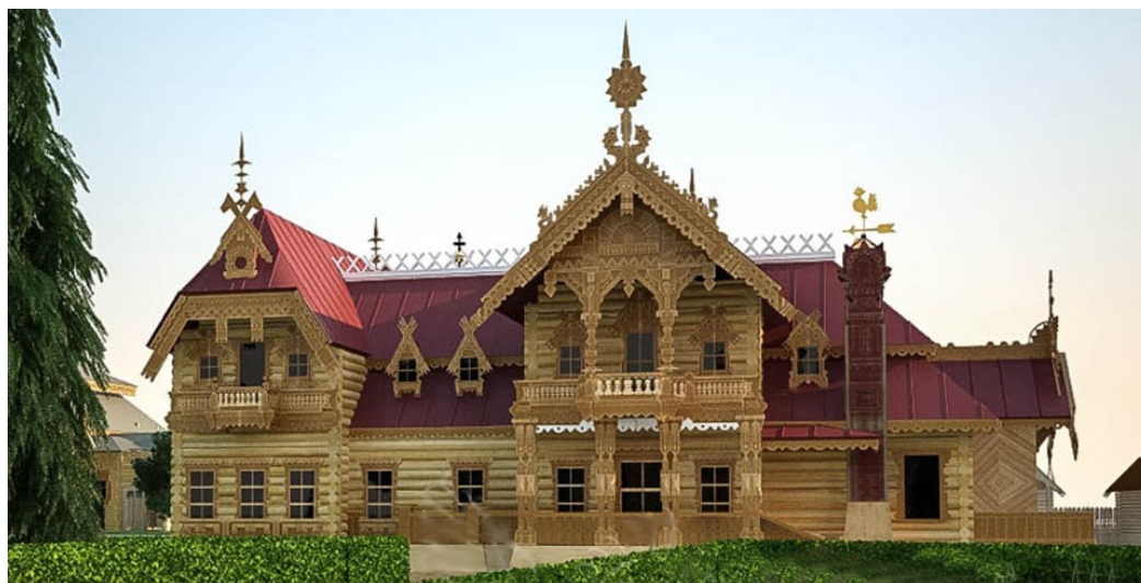
Рис. 2 Гостиница в русском стиле по проекту «Великий Устюг»

Ярким примером синтеза народного русского орнамента с современным домостроением является гостиница в русском стиле, выполненная по проекту «Великий Устюг» (рис.2). Концептуальное решение проекта основано на дизайнерском образе русского деревянного