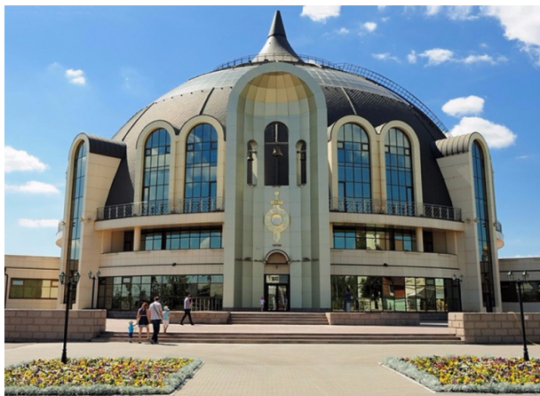
Рис. 3 Тульский государственный музей оружия

Другим примером идентичности современной архитектуры России является Тульский государственный музей оружия (рис. 3). Архитектура нового здания Тульского государственного музея оружия отличается выразительным и символическим дизайном.