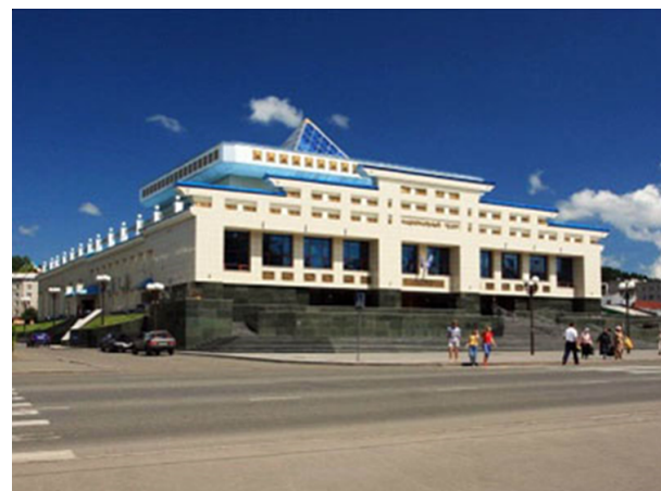
Рис.4 Национальный театр в Горно-Алтайске

чередовании вертикальных элементов и горизонтального членения здания. Используются архитектурные элементы русского православного храма (арочные проемы, купол, закомары) в современной интерпретации. Большие оконные остекления придают зданию облегченный современный вид. Функциональная планировка здания делится на выставочные и экспозиционные зоны, оборудованные с использованием современных технологий, таких как голографические витрины и интерактивные площадки.